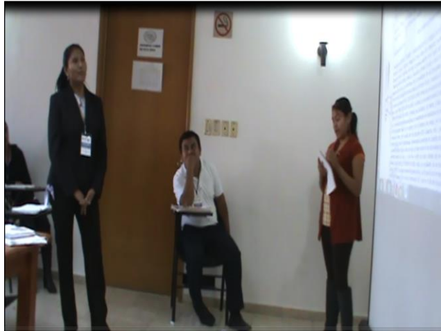
Ilustración 3: Ejercicio TAVCONRETRO

lectura en una lengua indígena con una grabadora reportera de buena calidad. Una vez grabado cada segmento, ya en clase se reproduce el audio para realizar el ejercicio de interpretación, de manera que se escucha una narración en lengua indígena. Una persona hablante de la misma variante lingüística interpreta la narración de regreso al español. Este ejercicio evolucionó posteriormente, ya sin grabación de por medio, en la proyección de un texto donde la traducción a la vista y su interpretación consecutiva (TAVCONRETRO) se lleva a cabo en un solo ejercicio con dos participantes.